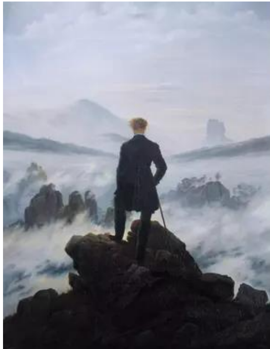
'Der Wanderer über dem Nebelmeer' (1818)

Tableau du peintre allemand Caspar David Friedrich (1774-1840) exposé à la Kunsthalle de Hambourg 250 Jahre CD Friedrich